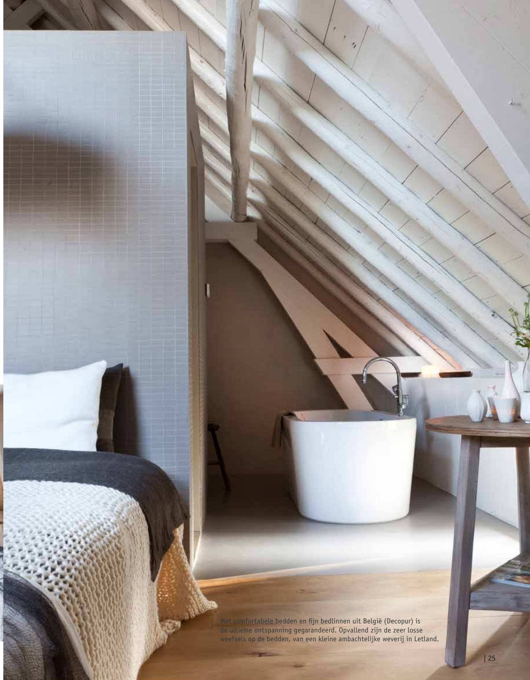
Met comfortabele bedden en fijn bedlinnen uit België (Decopur) is de ultieme ontspanning gegarandeerd. Opvallend zijn de zeer losse weefsels op de bedden, van een kleine ambachtelijke weverij in Letland.