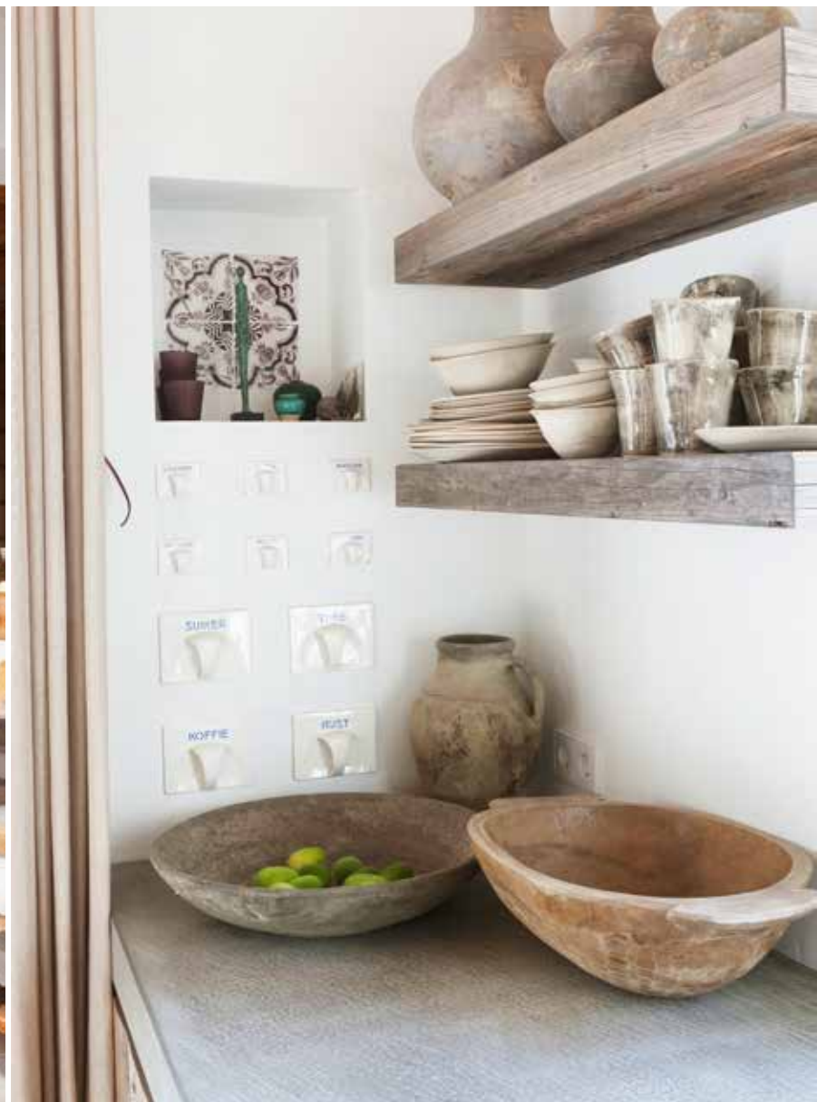
Het keukenblok werd op maat gemaakt van oud hout en voorzien van een betonnen werkblad (Marco Boers Interieurs en Afwerking, Soest). Serviesgoed van het Zuid-Afrikaanse merk Wonki Ware past perfect in de aardse sfeer.