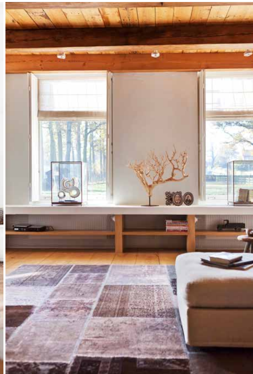
In de woonkamer biedt een lage vensterbank plaats aan allerlei decoratieve voorwerpen met een natuurlijke look (kannen en kruiken van Pols Potten). De kamer is voorzien van een vloer van Franse eiken planken (Houthandel Houtex, Waddinxveen). Daarop ligt een decoratief patchwork tapijt.